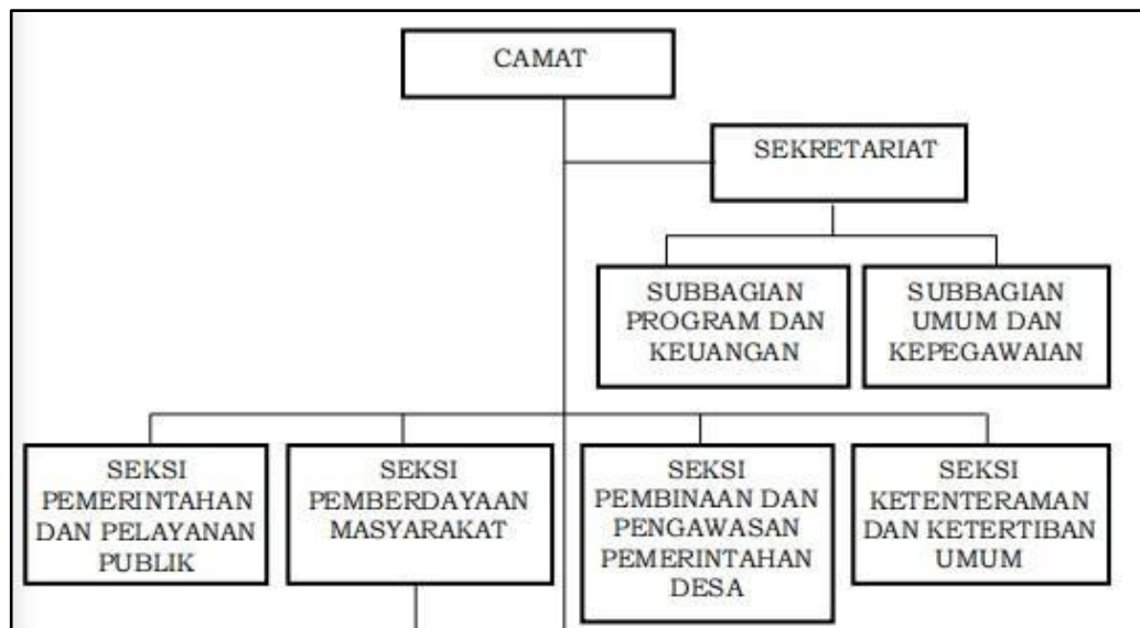
Gambar 1.2 Struktur Organisasi Kecamatan Sale

Berdasarkan bagan tersebut dijelaskan tugas dan fungsi berikut: